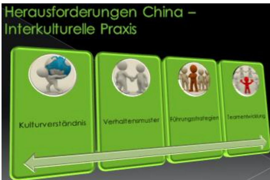
Abbildung 1 Herausforderungen China

Spannend wird es auch bei dem Thema Zusagen von Entscheidungen. Wer hat schon einmal einen Asiaten nein sagen gehört? Nein, ist